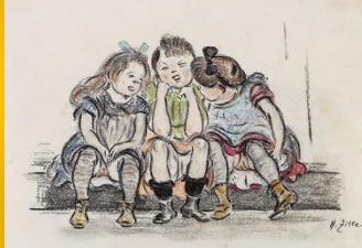
z. B. Heinrich Zille (1858 - 1929)

mit Bücherfestival „Antikes und Rares für Bares“